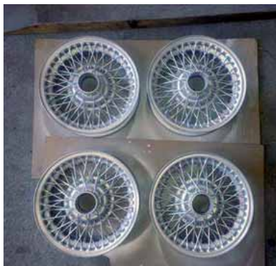
Frisch lackierte Speichenfelgen