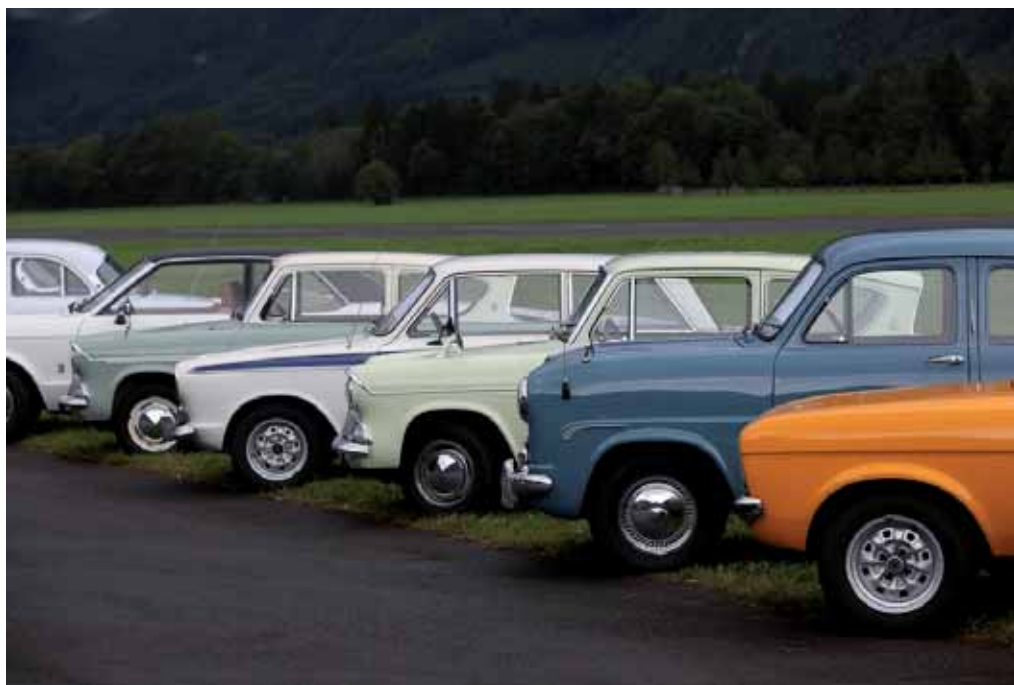
Englische Ford als Ehrengäste

Zum 34. Mal lud der TR Club zum BCM, und zum 34. Mal machten sich Hunderte von britischen Klassikern aller Baujahre (bis in die Neuzeit) auf, um sich im Kanton Glarus zu treffen. Wegen des nicht ganz sicheren Wetters landeten zwar höchstens 1200 Autos auf dem Flugplatz Mollis, aber die Auswahl konnte sich sehen lassen.