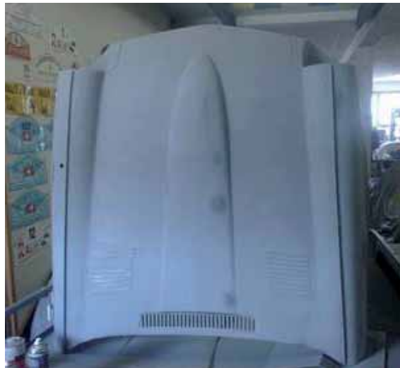
Optisch von Weitem heil