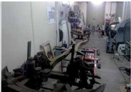
Der nackte Rahmen